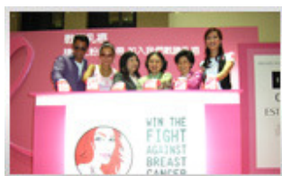
多位嘉賓主持亮燈儀式。